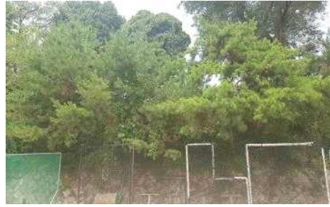
선린중·고교 나무 후면