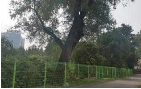
선린중·고교 나무 전경